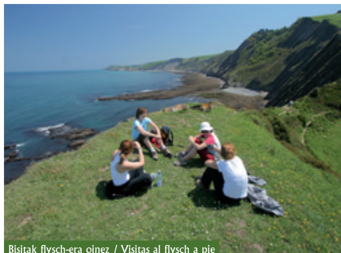
Bisitak flysch-era oinez / Visitas al flysch a pie

Vasco ", 7 en Zumaia, 13 en Deba y 144 en Mutriku, de los cuales 130 corresponden al Conjunto Monumental de Mutriku , situados en su casco histórico. En todo este patrimonio destacan especialmente iglesias, ermitas, conventos, palacios, edificios urbanos, caseríos, calzadas, etc., y completan el patrimonio de la zona otro sinnúmero de elementos como los caleros, antiguas canteras, atalayas, el Camino de Santiago de la Costa y un largo etcétera.