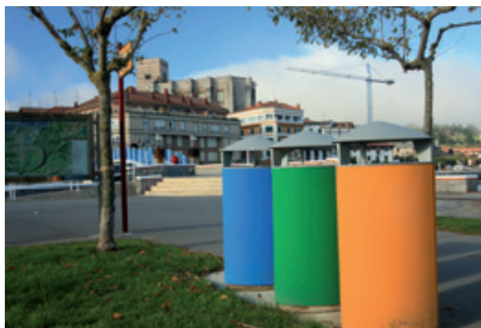
Hondakinen sailkapena Zumaian / Clasificación de residuos en Zumaia