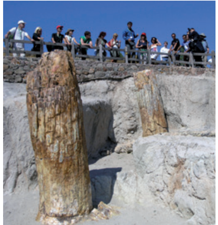
Lesvoseko harri bihurtutako basoa. Grezia. Bosque petrificado de Lesvos. Grecia.