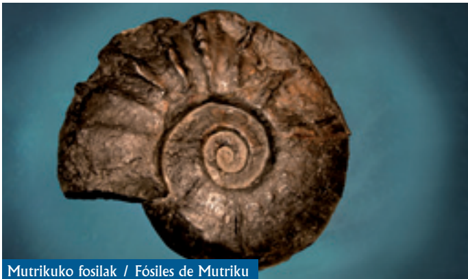
Mutrikuko fosilak / Fósiles de Mutriku