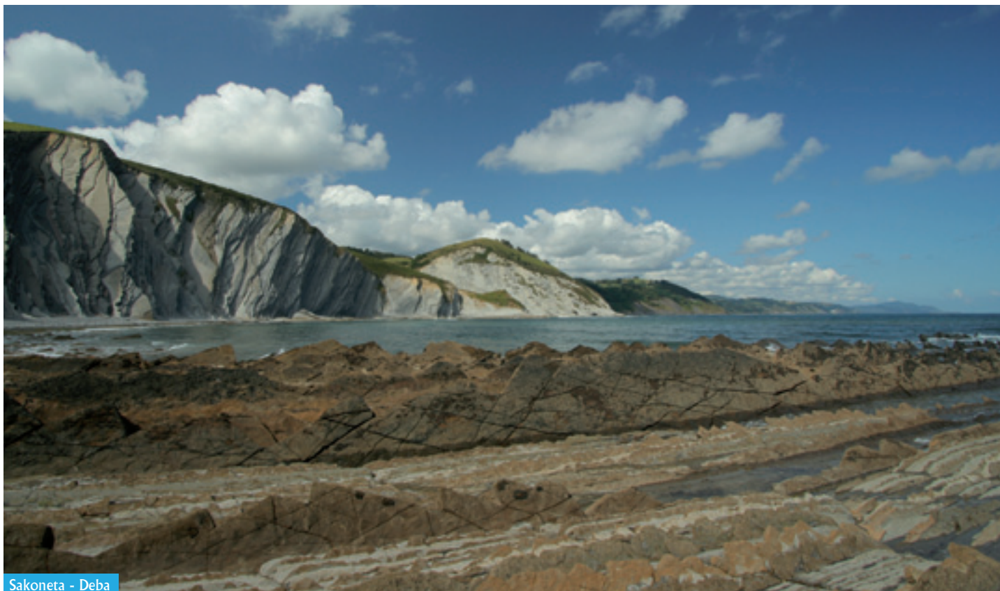
Sakoneta - Deba

La idea central de los geoparques consiste en un modelo que impulse el desarrollo local mediante la puesta en valor sostenible del patrimonio geológico y natural. Un Geoparque aspira así a ser el puente entre un lugar, su patrimonio y sus habitantes, es decir, en ser un elemento que conecte a las personas con su medio. Dicho de otro modo consiste en favorecer que los habitantes se reapropien de los valores del territorio y que participen en su revitalización general. Por ello en los geoparques el ámbito geológico es importante, pero realmente las personas que habitan en él son la clave de todo. Así, por ejemplo, en nuestro caso el proyecto pretende ayudar a recuperar elementos como la memoria de las tradiciones, los oficios antiguos, la gastronomía local o la transmisión de mitos y leyendas, entre otros.