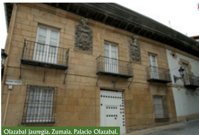
Olazabal jauregia, Zumaia. Palacio Olazabal.

Debako udalerrian garai horretako bi labar-hobi garrantzitsu daude, Ekaingo eta Praileaitzeko kobazuloak, hain zuzen ere. Esan behar da Ekaingo kobazuloko labar-pinturak (Madeleinekoak) Frantziako eta Kantauriko horma-artearen hoberenen artean daudela , eta, zehazki, zaldien irudiak espezie horretako goreneko ordezkarietat hartuta daude horma-artearen barruan. Horregatik, Ekaingo haitzuloa Kultura Ondasun Kalifikatu izendatu zuten, eta 2008an, Gizateriaren Ondare gisa kalifikatu zuen UNESCOK . Bestalde, Praileaitzeko haitzuloan hainbat labar-pintura daude, baina bereziki nabarmentzen da haitzulo horretan Paleolitikoko arte higigarriko hainbat material -dimentsio mugatuko objektu maneigarriak, garraia daitezkeenak- identifikatu direlako (esate baterako, zintzilikariak) baita leku hori antzinako gurtzeko lekutzat edo paleolitikoko benetako santutegitzat hartzea eragiten duten beste elementu batzuk daudelako ere. Azken batean, esan dezakegu haitzulo horiek Gipuzkoako lehenengo arte-adierazpenak biltzen dituztela.