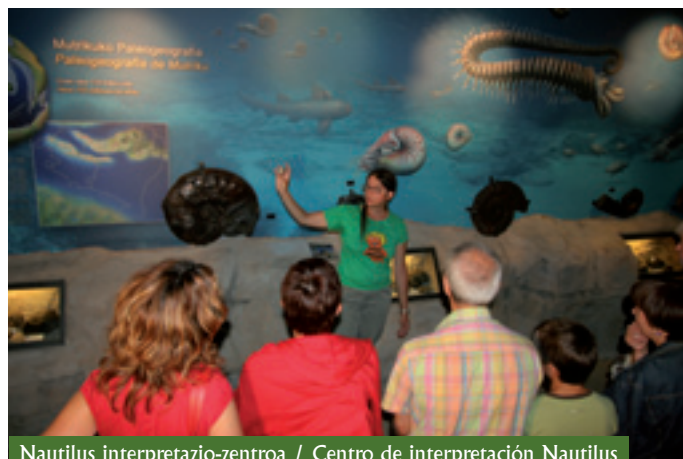
Nautilus interpretazio-zentroa / Centro de interpretación Nautilus

Desde una perspectiva más reciente el territorio ostenta un notable recorrido en un conjunto de iniciativas que han dado frutos. Por ello, y a modo de antecedentes, se muestra a continuación una breve relación de hitos del desarrollo territorial, la geoconservación, puesta en valor del patrimonio geológico y natural de la zona y turismo en los últimos doce años: