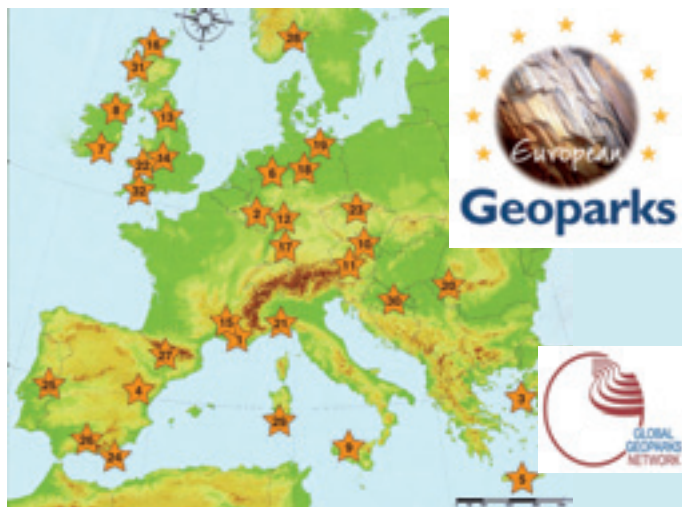
Europako geoparkeen mapa (2009) Mapa de los geoparques europeos

6. Un Geoparque Europeo debe trabajar dentro de la Red Europea de Geoparques para favorecer la construcción y la cohesión de la Red. Debe trabajar con empresas locales para promover y apoyar la creación de nuevos productos ligados al patrimonio geológico en un espíritu de complementariedad con los otros miembros europeos de la Red de Geoparques.