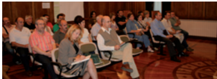
Proiektua herritarrei aurkeztea eta parte hartzeko prozesua Presentación del proyecto a la ciudadanía y proceso participativo