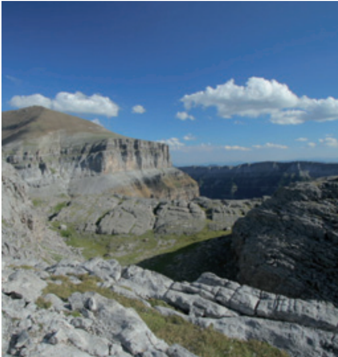
Ordesako Parke Nazionala - Sobrarbeko Geoparkea Parque Nacional de Ordesa - Geoparque de Sobrarbe

patrimonio geológico, para lo cual buscaron posibles socios. Cuatro territorios, que hasta entonces se desconocían entre sí, decidieron unir sus esfuerzos: la Reserva Geológica de Haute-Provence (Francia), el Bosque Petrificado de Lesvos (Grecia), el Parque Geológico de Gerolstein / Vulkaneifel (Alemania) y el Parque Cultural del Maestrazgo (España). En junio de 2000, en la isla de Lesvos, los cuatro territorios firmaron el acuerdo que daba inicio a la Red Europea de Geoparques con el apoyo de la Unión Europea, un acuerdo con la finalidad de intercambiar información, experiencia, y avanzar en la definición de herramientas comunes de trabajo. De igual manera se creó la marca de Geoparque Europeo, registrada en el ámbito de Europa.