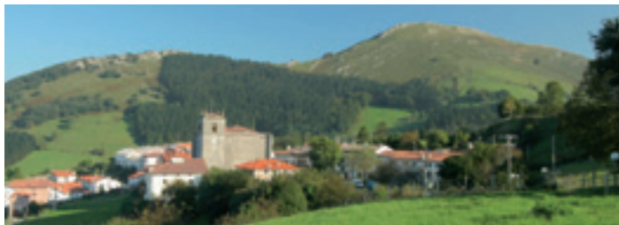
Itziar Santutegia eta Andutz mendia Santuario de itziar y monte Andutz