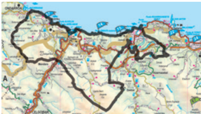
Geoparke izendatua izateko hautagai den lurraldearen mapa Mapa del territorio candidato a geoparque

Geoparkeen Europako Sarean sartzeko proiektuaren oinarri diren balio geologiko, natural eta kultural garrantzitsu asko ditu lurralde hautagaiak. Jarraian, lurraldearen ezaugarri nagusiak aipatuko ditugu, eta lurralde honen ezaugarri diren ondare-balio nagusi batzuk laburbilduko ditugu.