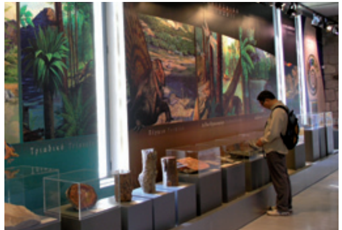
Lesvoseko harri bihurtutako basoaren museoa Museo del bosque petrificado de Lesvos

Geoparkeen Europako Sarea espiritu ireki eta demokratiko baten pean jarduten duen elkarte da, eta kide diren lurralde guztien ordezkariak zuzentzen dute. Bi egitura eragilek osatzen dute, alde batetik, Batzorde Aholkulariak , sareari aholkuak ematen dizkio erabakiei eta estrategiari buruz, eta bestetik, Koordinazio Batzordea , erabakiak hartzeko organoa, sarea kudeatzeaz arduratzen dena. Bi Batzorde horiek, gainera, Geoparkeen Europako Sarearen koordinatzailearen (EGN) eta koordinatzaileordearen irudiak dituzte.