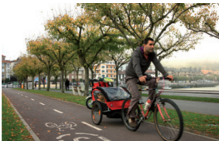
Lurralde horrek zabaltzen ari den bidegorri-sare bat du El territorio dispone de una red de bidegorris en expansión