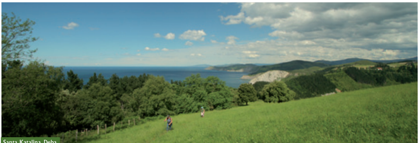
Santa Katalina. Deba

6. MONTE ANDUTZ (Catálogo abierto de espacios naturales relevantes de la CAPV, 1996). 209 ha. El monte Andutz es un crestón calizo muy próximo al mar y que alcanza la cota de 610 m. Está conformado por calizas arrecifales del Cretácico y presenta intensas manifestaciones kársticas (dolinak, sumideros, lapiazak...). En relación a su vegetación destaca la existencia de una masa considerable de encinar cantábrico y sus comunidades asociadas.