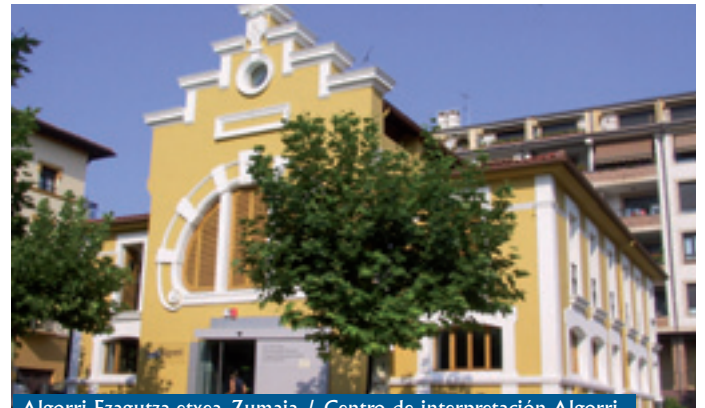
Algorri Ezagutza-etxea, Zumaia / Centro de interpretación Algorri