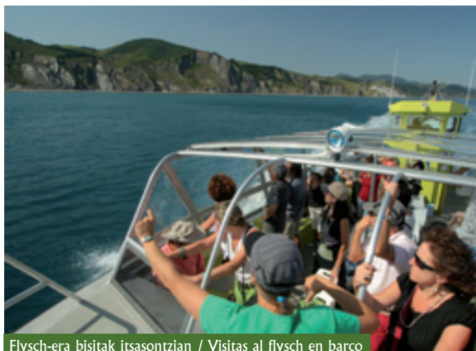
Flysch-era bisitak itsasontzian / Visitas al flysch en barco

Zumaian, 13 Deban eta 144 Mutriku, eta horietatik 130 Mutrikuko Monumentu Multzokoak dira, eta Mutrikuko hirigune historikoan daude. Ondare horretan guztian elizak, ermitak, komentuak, jauregiak, hiri-eraikinak, baserriak, galtzadak eta abar nabarmentzen dira; horretaz gain, beste elementu askok eta askok osatzen dute eremu horretako ondarea, hala nola karobiek, antzinako harrobiek, talaiek, Kostaldeko Done Jakue Bideak eta abarrek.