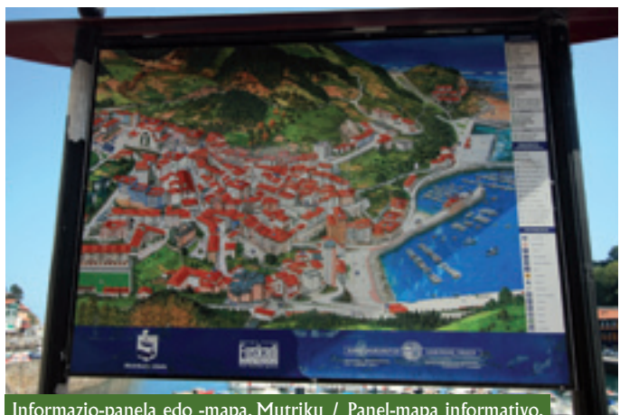
Informazio-panela edo -mapa, Mutriku / Panel-mapa informativo.

Hurbilagoko ikuspegian oinarrituta, lurralde horrek ibilbide nabarmena izan du emaitzak eman dituzten ekimen multzo batean. Horregatik, eta aurrekari gisa, azken hamabi urte hauetan izandako lurralde-garapenari, geozaintzari, eremu horretako ondare geologikoari eta naturalari balioa emateari eta turismoari buruzko une garrantzitsuei buruzko zerrenda labur bat egingo dugu jarraian: